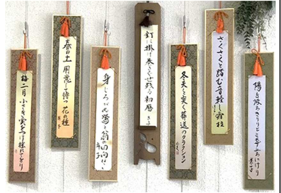
俳句教室「あけぼの」生徒さんの作品