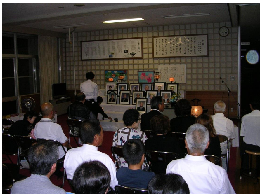
供養のお経をとなえる 元行寺住職