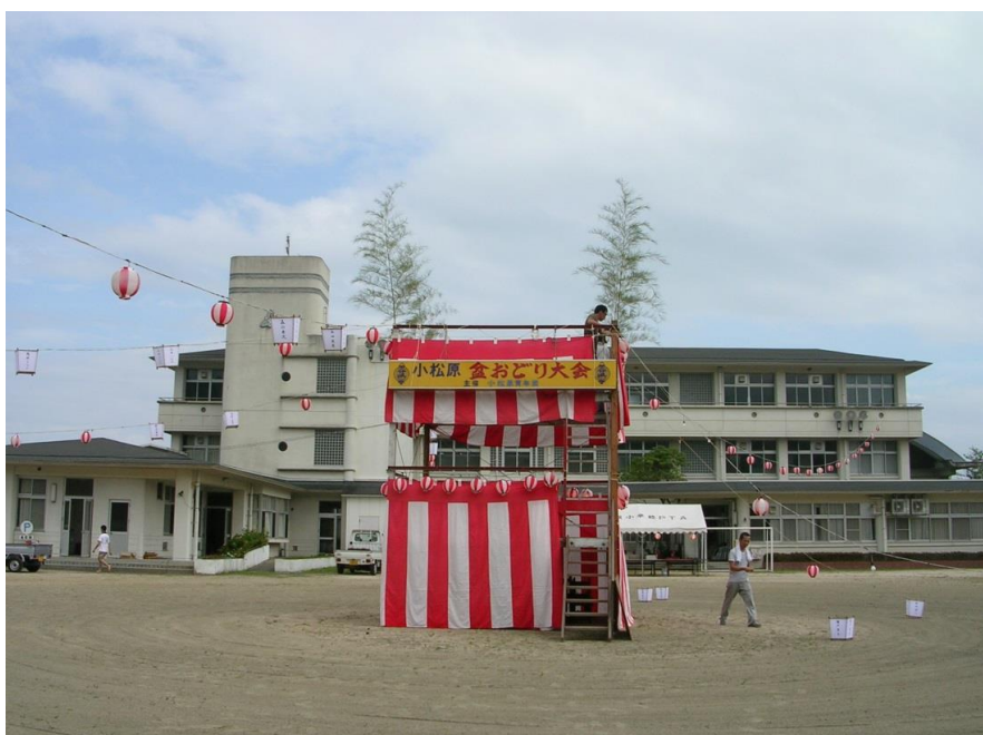
例年通り設営 されたやぐら

今年は15名の物故者の新霊供養が行われました。あいにくの荒天で、急拠小学校のマリンルームに設置された祭壇で、この1年に亡くなられた方を偲び霊をなぐさめました。読経は元行寺住職によって取り行われ遺族、親族並びに縁故者が見守るなか滞りなくすすめられました。物故者のご冥福をあらためてここにお祈りいたします。