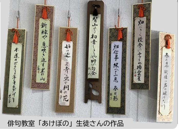
俳句教室「あけぼの」生徒さんの作品