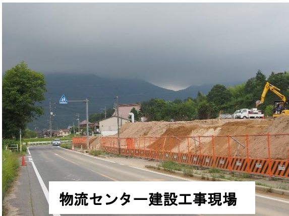
物流センター建設工事現場