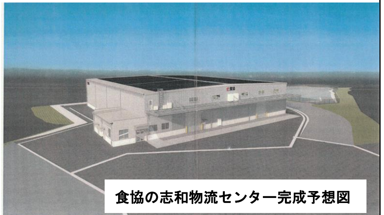
食協の志和物流センター完成予想図

西蓮寺から志和インター方面へ少し行くと、左側の山すそに大掛かりな土地造成工事を行っている場所があります。何が出来るのかなと思われた方も多いと思いますが、実は食協グループの物流を担う食協ロジスティクス(株)が建設している「志和物流センター」でした。