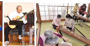
琴の会の皆さんで[和楽器で楽しもう]→