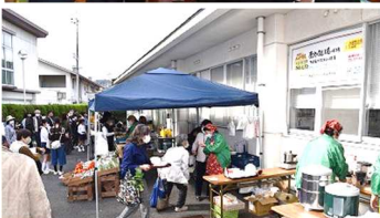
↑上：保育所・小学生の展示 ↑下：ふれあいの里(中庭)

コロナ禍以後、会場を1ヶ所にし、展示もコンパクトにしていますが、年々作品を持ち寄られる住民の方も増えつつあります。また住民の方他、今年も医療保健課、学生団体キッチンワーカー、酒蔵食堂、ドルエシフォン、マイクロメモリジャパン社の皆さんの協力をいただきました。当日の様様を写真で紹介いたします。