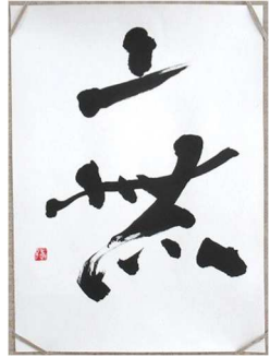
↑住民の方から提供いただき展示