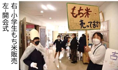
左開会式 右小学生もち米販売