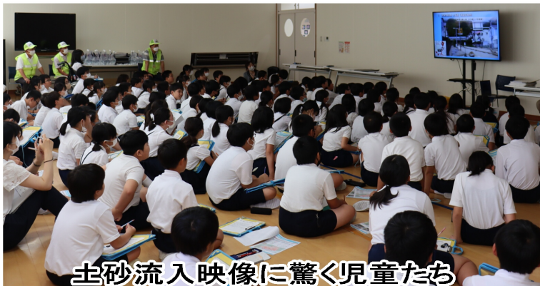
土砂流入映像に驚く児童たち