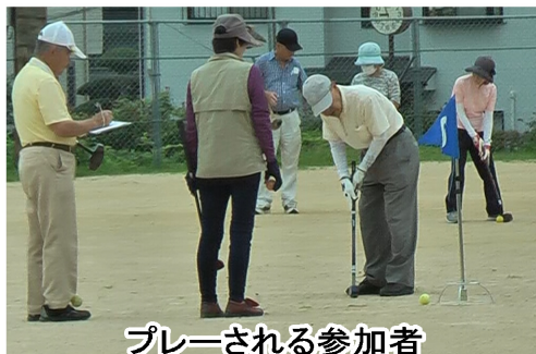
プレーされる参加者

参加者は4人1組で長短設置されたホールポストを狙い、ボールを打ち各コースを回った。