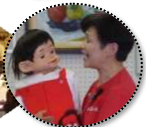
生涯学習ボランティア代表