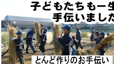
とんと作りのお手伝い