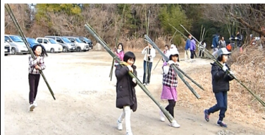
餅焼き用の竹運び 何回も往復しました