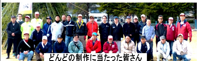
とんとのはたきにあたった皆さん