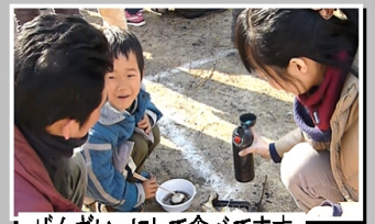
ぜんざいにして食べてます