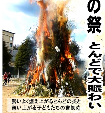
勢いよく燃え上がるどんどのはたきと 舞い上がる子どもたちの書初め