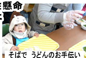
そばでうどんのお手伝い