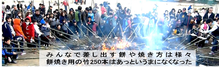
みんなで差し出す餅や焼き方は様々 餅焼き用の竹250本はあっというまになくなった