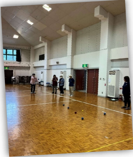
6/3・17anybody スポーツ教室(ペタンク)