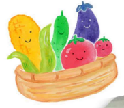
6/15初めての野菜づくり②