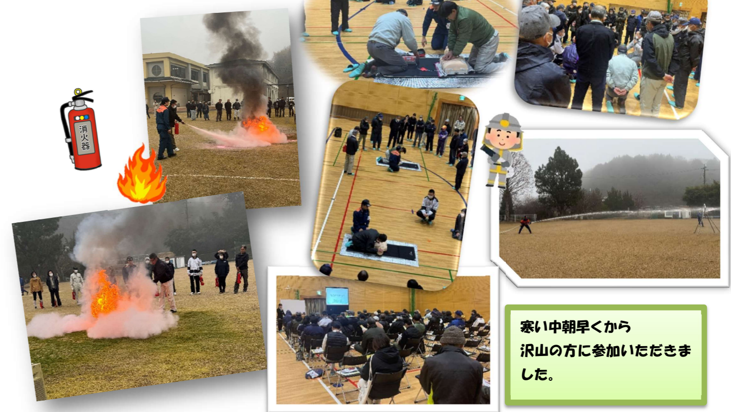
3/2(日)篋の郷 防災訓練