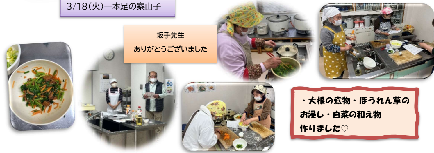
3/18(火)一本足の案山子