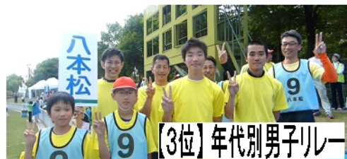
【3位】年代別男子リレー