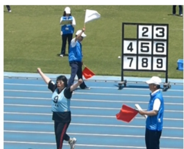
【6位】ストラックアウト