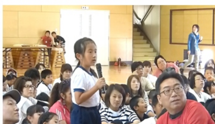
危険な場所を答える子ども達