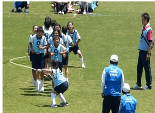
【4位】みんなでジャンプ