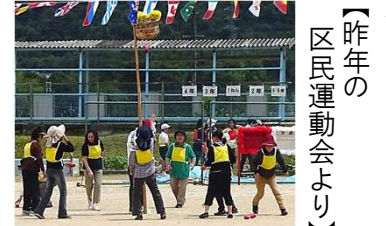
【昨年の区民運動会より】