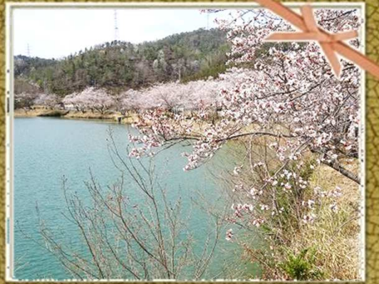
4月1日、豊穰池の桜-9部咲き