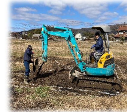
公園整備作業風景