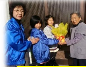
子ども民生委員活動