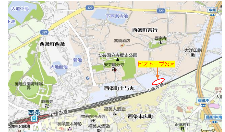
東広島市西条町土与丸 国分寺公園前(南側)

式典当日、お車でお越しの方は東西条地域センターまたは国分寺公園をご利用ください。(8月予定：別途案内) 式典後、ピオトープ公園はいつでも見学できます。