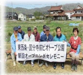
東西条・国分寺前ピオトープ公園 新設オープニングセレモニー