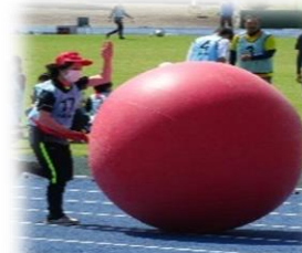
市民スポーツ大会