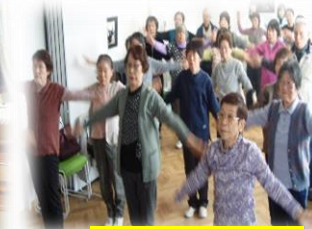
地域介護予防活動