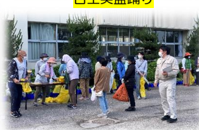
公衛協の清掃活動