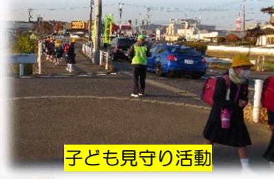
子ども見守り活動