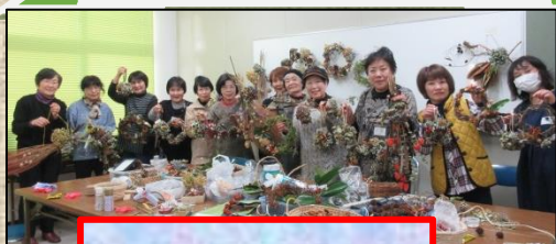
山からのおくりもの