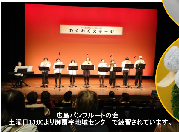
広島パンフルートの会 土曜日13:00より御園宇地域センターで練習されています。