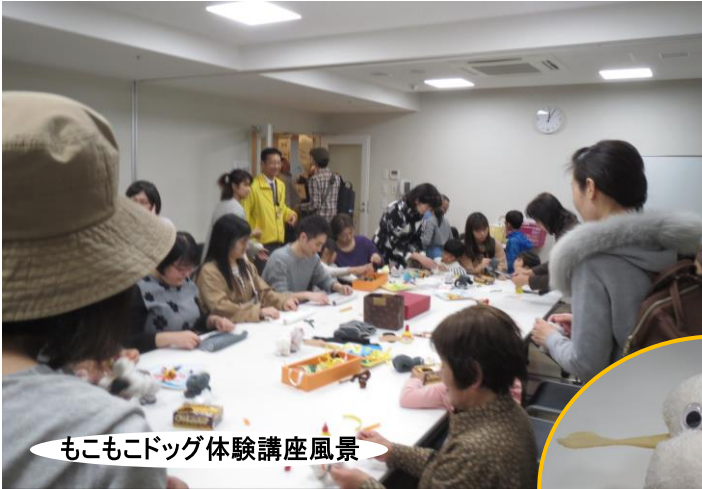
ももこドッグ体験講座風景