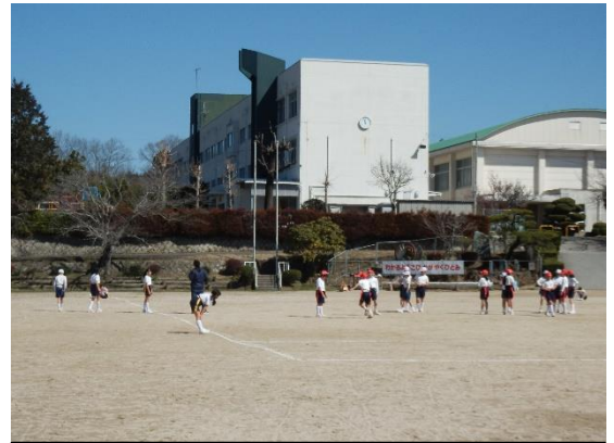
運動場から見た西志和小学校