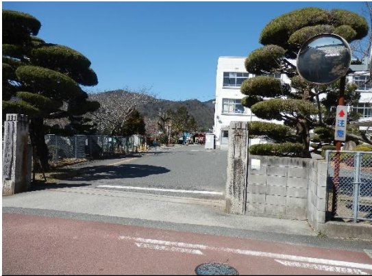
正門付近の西志和小学校