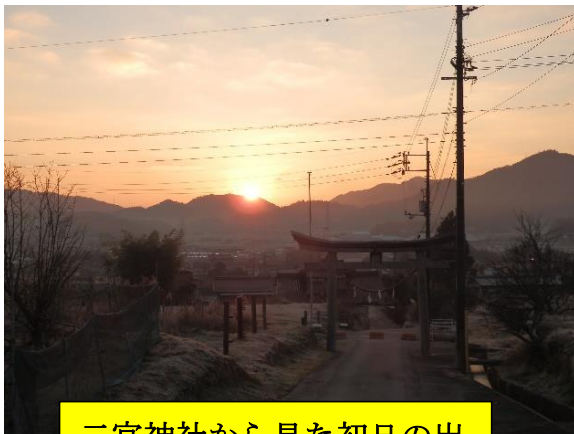
二宮神社から見た初日の出

4月は理事会・役員会・総会も控えていますので、方針等協議し、出来るものから取り組んでいきます。どうぞよろしくお願い申し上げます