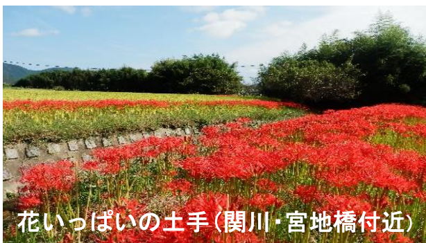
花いっぱいの土手(関川・宮地橋付近)