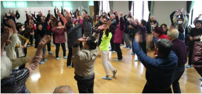
▲サロン拡大交流会

○平成30年2月8日、西志和コミュニティハウスでサロン拡大交流会が実施されました。