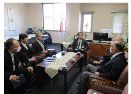
▲津森教育長と懇談