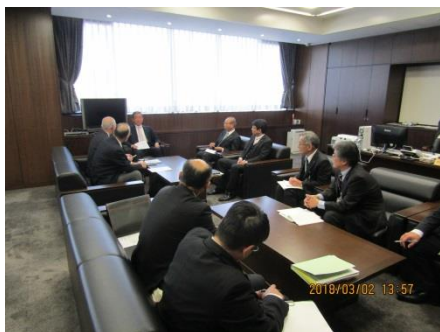
▲高垣市長及び市の幹部と懇談