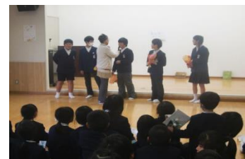
▲わくわく祭り（6年生を送る会）