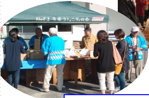
旬の野菜や果物は早い時間に売り切れました

東広島市平岩地域センター 〒739-0041 東広島市西条町寺家 520-12 TEL/FAX (082) 422-4930