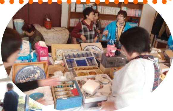
遊休品バザーは毎回大人気です