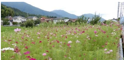
郵便局の横にコスモスが咲きました