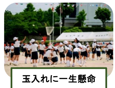
玉入れに一生懸命