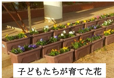
子どもたちが育てた花

児童一人が一鉢を担当して学校を花で飾る活動。そのお手伝いをと学校関係者を含む9名でプランターの土を入替えました。今、子ども達がパンジーやビオラを育てています。