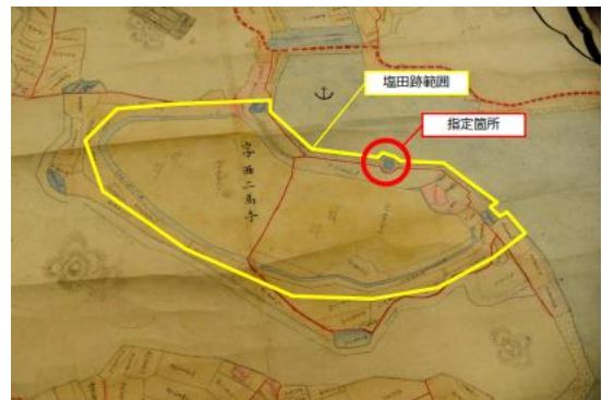
木谷村絵図(二馬手塩田跡付近:明治初期)

安芸津町の塩田の遺構はほとんど残っていないが、その中であって本物件は遺構と史料がともに伝来し、塩田の歴史を学ぶことができる貴重な事例である。