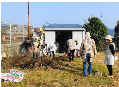
10/16 プランターの土を入替え