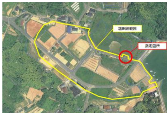
空中写真(二馬手塩田跡付近:令和2年)