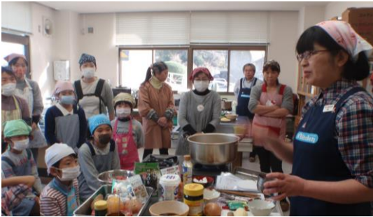
森永乳業の東栄養士の説明を聞いています