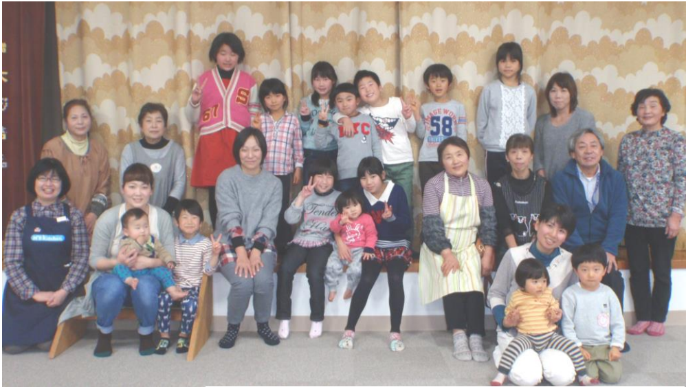
全員集合写真、パチリ！！