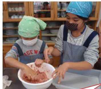
ハンバーグを作っています。