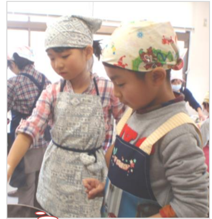
椅子に上がって兄弟で仲良く挑戦！！