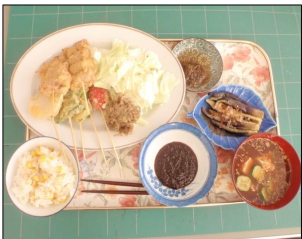
【男の定食(令和元年 7月)】