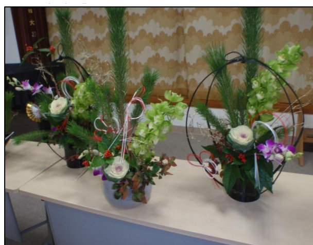
【正月花アレンジメント(令和元年 12月)】

今年度も多くの皆様の参加ご協力により様々な講座を開催することができました。来年度も出来る限り皆様のご意見・ご要望に沿えられるような講座にしたいと思っておりますのでご協力よろしくお願いいたします。