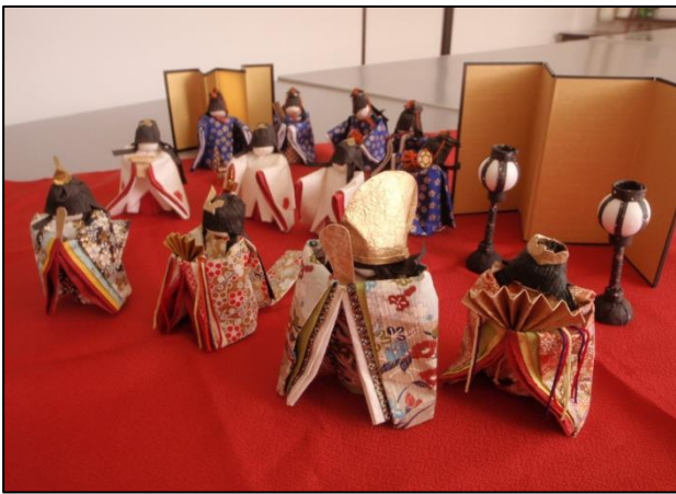
【藤田桂子先生の作品】

1月31日(金)藤田桂子先生のご指導により和紙で作る2体の『麻呂ちゃん雛』を作成しました。それぞれ好きな和紙を選んで、それぞれにかわいいお雛様が出来上がりました。先生が作られた作品も見せていただきました。