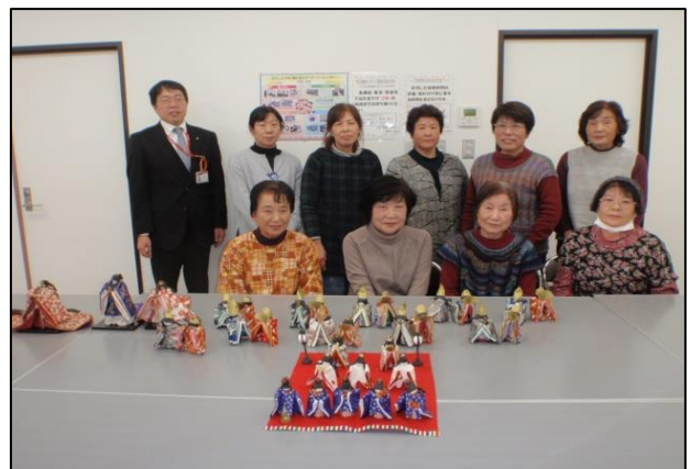
【参加者のみなさん】