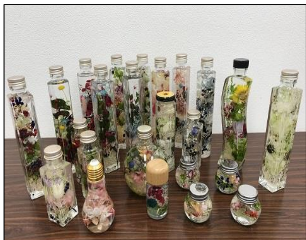
【ハーバリウム(令和元年 7月)】