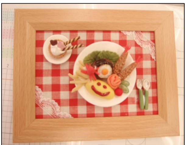
【粘土でお子様ランチを作ろう （令和元年 12月）】