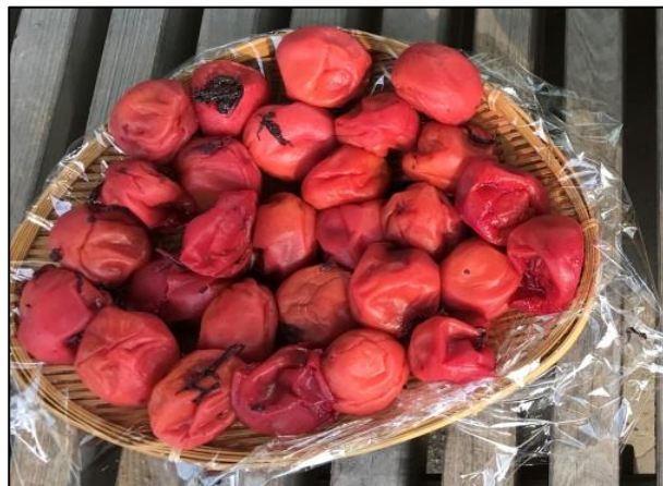
【梅干作り（令和元年6月）】