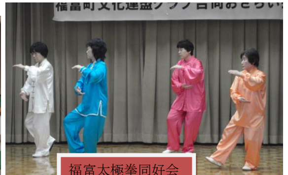
福富太極拳同好会