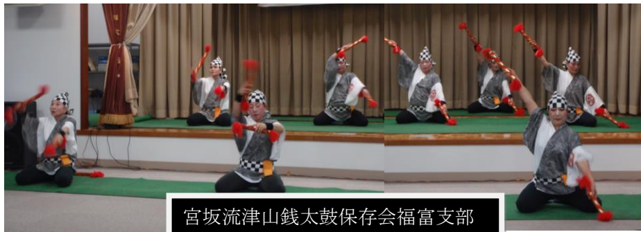
宮坂流津山銭太鼓保存会福富支部