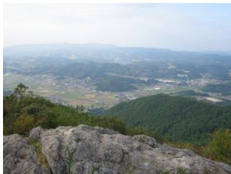
板鍋山 山頂からの眺め

標高757メートル。360度見渡せる頂上からの眺めは素晴らしく、とりわけ秋の雲海は絶景。また、山頂には、東屋のある公園「なごみ園」があります。山頂付近まで車で行くことができ、家族での登山に最適です。