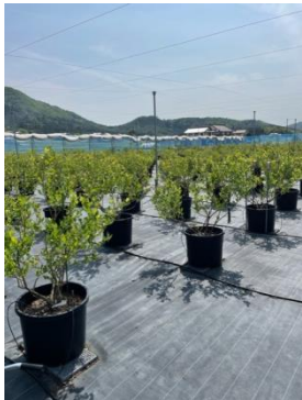
とよさかブルーベリーガーデン