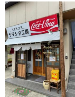
食事処ヤマシタ工房