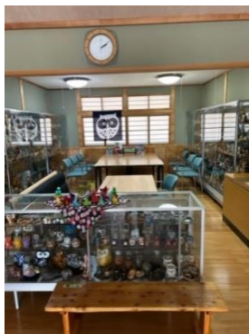
ふくろうの置物や玩具 1,200個陳列

【利用可能時間】 8時30分～22時まで ※ただし、月曜日・水曜日・金曜日の9時～12時以外の時間については、電話に出ることができない場合があります。