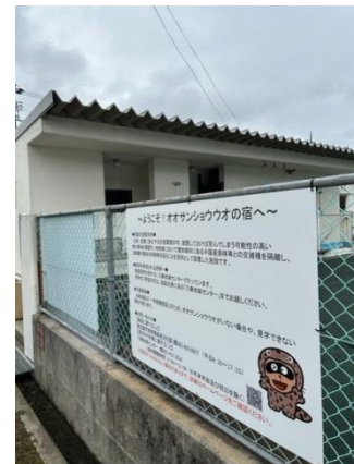
オオサンショウウオの宿