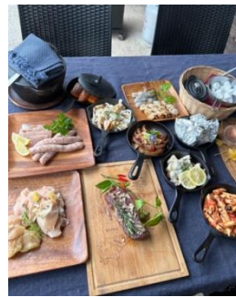
宙と廷バーベキュー