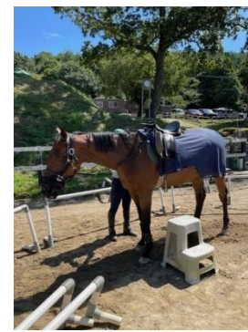
乗馬クラブクレイン東広島