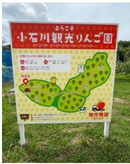
小石川観光りんご園