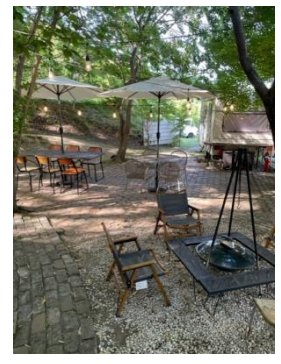
リ・カムアクロス