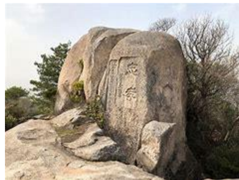
天神獄 山頂にある巨石

標高757メートル。古くから霊峰として信仰を集めてきました。頂上には、元内務大臣・望月圭介書「忠考」を刻字した巨石や多くの石地蔵が置かれています。吉原・安宿両方から登山道があります徒歩約1時間～1時間半(車では登れません)。