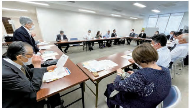
作文審査会の模様