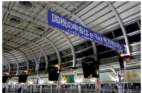
横断幕まもなく設置完了