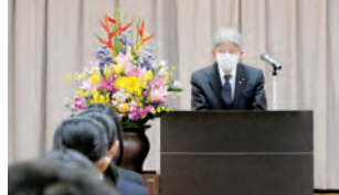
挨拶する東條会長