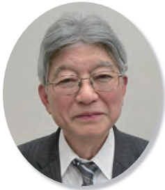
品川納税貯蓄組合連合会长