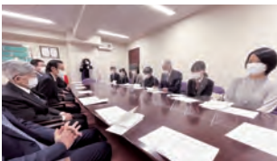
イベント打ち合わせ

イベントを終えての座談会で、生徒さんたちは、「税務署長」という得難い体験ができたこと、「税」が作文や今回の体験を通じて身近に感じられるようになったこと、自身の将来についても考えるきっかけとなったことなど、語ってくれました。