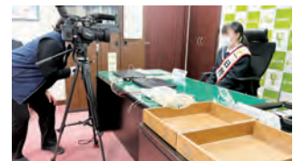
ケーブルテレビの取材を受ける内田さん