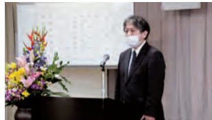
来賓として挨拶する 提坂品川区税務課長