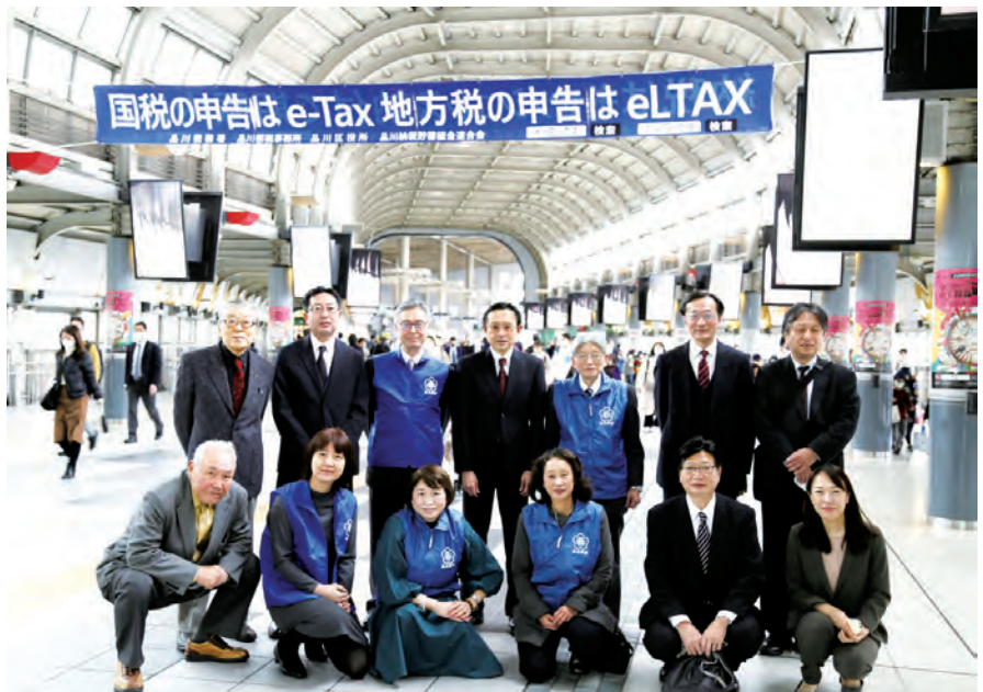
国税・都税・区税の方々と