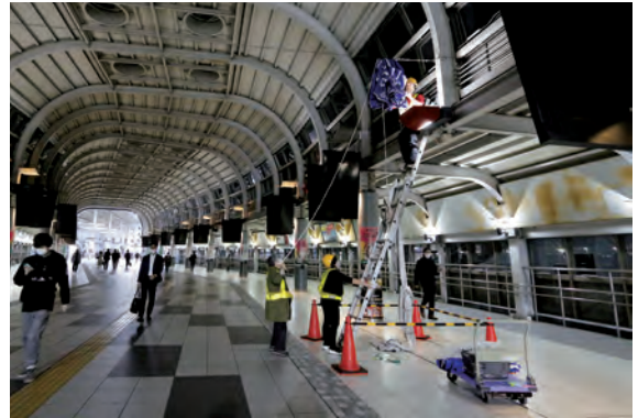
深夜の設置作業...途切れず人が往来します。

品川駅自由通路を歩く多くの方々にこの標語メッセージが届けられたのでは……と横断幕掲載効果を期待しています。