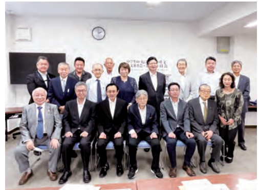
作文審査会に先立って出席者全員で集合写真