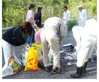
【戸坂地区の回収模様】

5月5日(日)、吉川地域では主要な道路わきに捨てられた「空缶・空瓶の回収作業」を実施しました。あわせて道路周辺に捨てられたごみの回収も行いました。今回、空缶18袋・空瓶9袋を収集しました。今年度も年4回作業を実施します。(次回は7月7日)