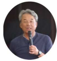
務めた 議長を 角谷さん

PJTを設置し検討を進めている。家を建てるのができないと多くの課題解決に進めない。