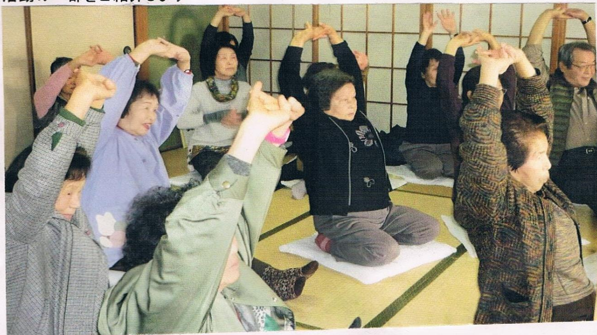
「しっかり 伸ばしてねえ～♪」 体験後「あ～あ 気持ちええ～♪」