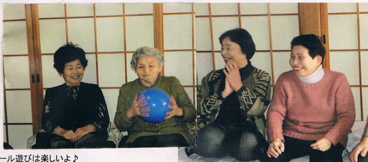
ボール遊びは楽しいよ♪