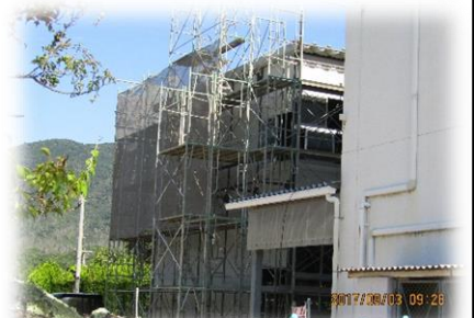
耐震プレハブ校舎建築中