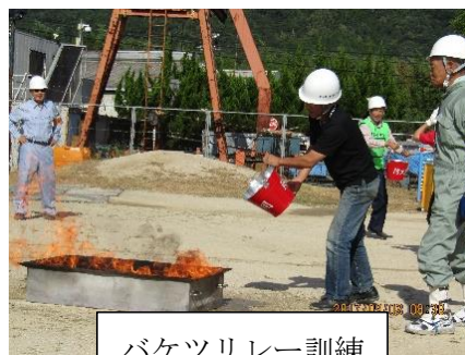
バケツリレー訓練