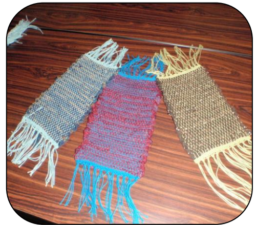
「作品 あと房の始末をして出来上がりです。」

手織りは、下の写真の卓上の織り機を使います。初めに縦糸をセットして、次に横糸を渡して、織っていきます。今回は、右の写真のミニマットを作りました。最初はぎこちない手つきでしたが、慣れてくるとスムーズにできるようになります。短い時間でしたが、手織りの楽しさを体験できたでしょうか。またチャレンジしてみてください。