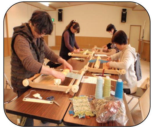
「慣れない作業に、初めは少し手間取りますが、だんだんとおもしろくなってきて、順調に進みました。」