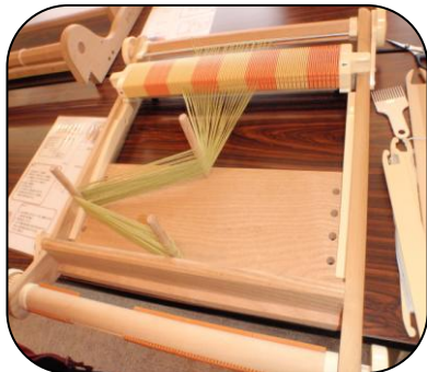
「織り機に縦糸をかけている途中」