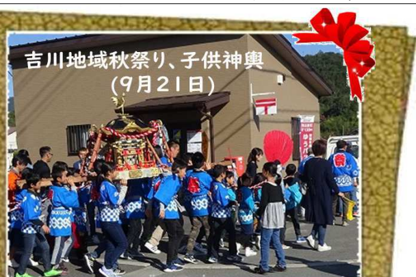
吉川地域秋祭り、子供神輿(9月21日)