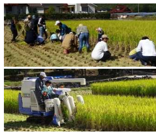
【コンバイン乗車体験】

今回は、6月の田植えに続いて稲刈りをメインに実施しました。吉川ツアーには、幼児と小学生の子供と保護者5組14名が参加