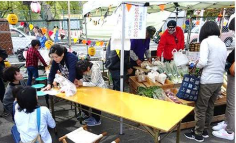
【吉川紹介活動とマーケット活動】

ひとむすびマーケット(地元大学生がプロデュース)が、10月28日生涯学習センター跡地に23店舗が出店し開催。吉川自治協も引続き参