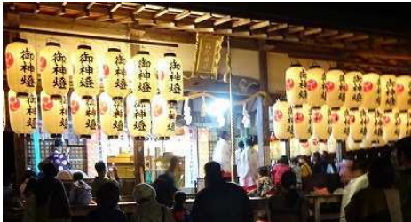
吉川小児童が巫女舞等を奉納