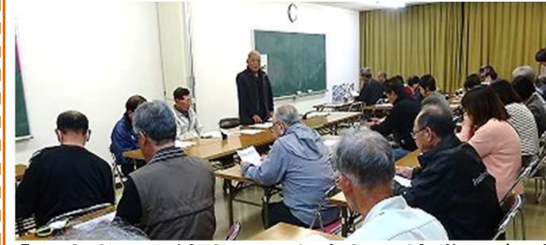
【出店者・出演者さんも参加し協議11/10】

会議には、出展、出店出演各グループ責任者、地区責任者、理事、役員、理事会推進委員35名が出席し、平成30年度吉川文化祭の実施要項について話し合いました。