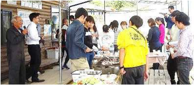
【参加者と地元と一緒にBBQ】

10月20日(土) 12時前から「東広島ゆるぽたサイクリングIN八本松」に参加した皆さんが吉川ふれあいの里で昼食休憩し、地元関係者と交流しました。 このイベントは、東広島市が支援する「ひがしひろしま学生×地域塾」に参加する大学生グループ「東広島ゆるぽたくらぶ」が企画し、地域の方との交流を通して、「地域で活動を実践するためのノウハウ等を学ぶこ