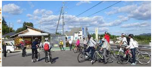
【サイクリング参加者-出発前のミイテング】