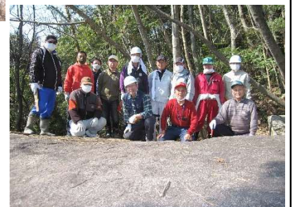
お手伝いして頂いた皆さんです

令和3年度以降の幟旗の標語は「皆で支えて助け合う 志和の町」に決定いたしました。