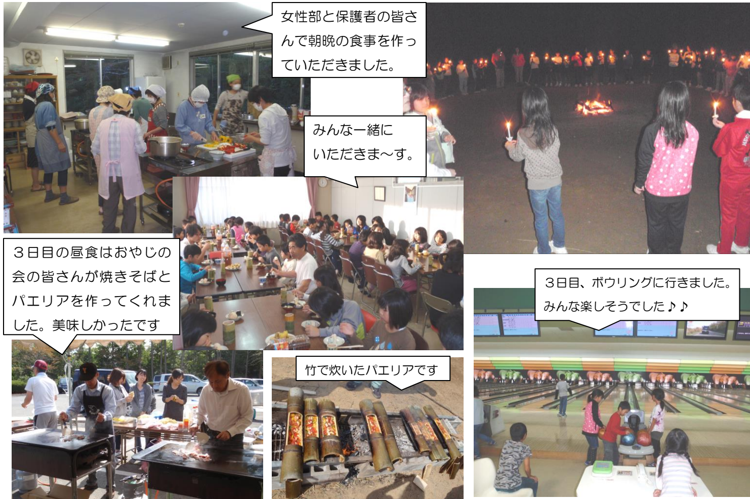
女性部と保護者の皆さんで朝晩の食事を作っていました。