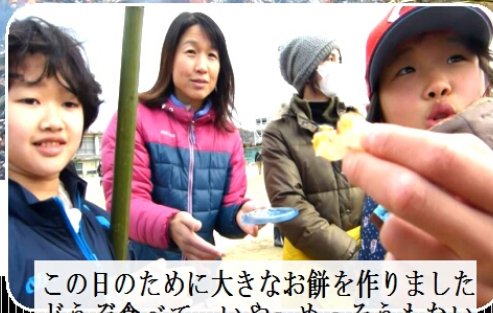
この日のために大きなお餅を作りました どうぞ食べて いや〜めっそうもない