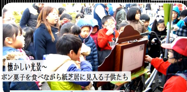
懐かしい光景〜 ボン菓子を食べながら紙芝居に見入る子供たち