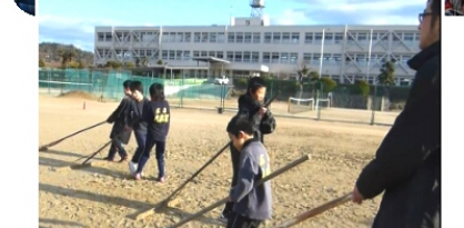
後片付けでグラウンド整備にがんばる子供たち ありがとう