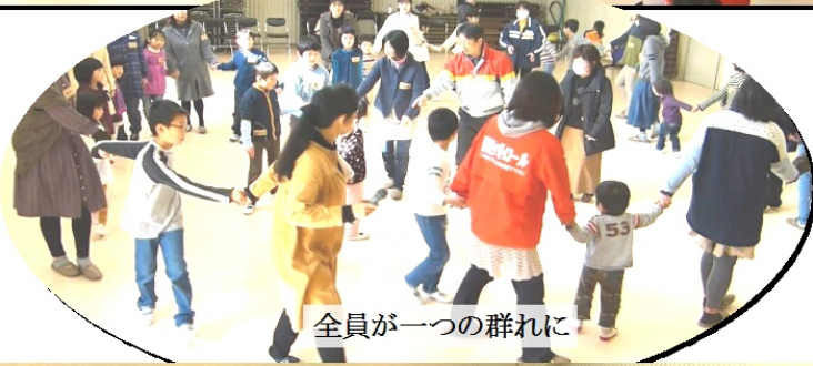
全員が一つの群れに