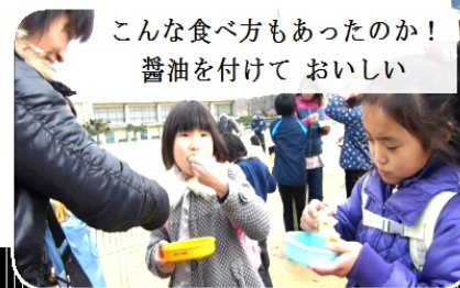
こんな食べ方もあったのか！ 醤油を付けて おいしい