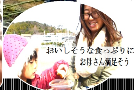
おいそうな食っぷりに お母さん満足そう