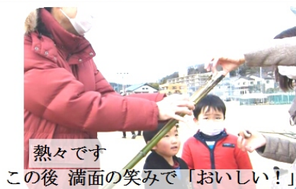
熱々です この後 満面の笑みで「おいしい！」