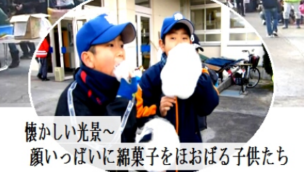
懐かしい光景〜 顔いっぱい綿菓子をほおぼる子供たち

住民自治協議会 は小学校区をあげ て「とんど祭り実 行委員会」を組織 し、2月1日中学 校グラウンドで 「八本松小学校区 とんどまつり」を 行った。 今年で11回目と なるこの行事は地 域の皆さんのふれ あいの場であると 共に子供たちがこ の伝統行事にふれ ることで故郷を想 う心を深めること を目的としたもの。 絶好の「とんど びより」で多くの 子供たちが集まり 参加者は500名と膨 れ、2つのとんど の燃焼で会場は大 賑わいとなった。