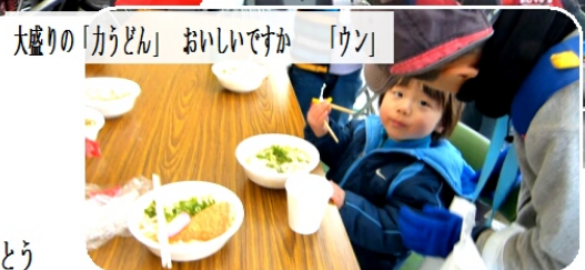
大盛りの「カうどん」 おいしいですか 「ウン」