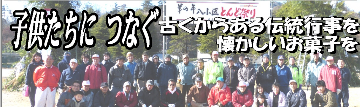
前日(31日)から100名を超える皆さんのご協力で点火を迎えることができました。特に、小学生の皆さんには雪で寒い中竹運びをしていただきました。写真は当日(1日)「とんど」の組み立てをしていただいた方々。皆さん有難うございました(自治協文化部)