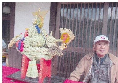
完成した宝船を前にして