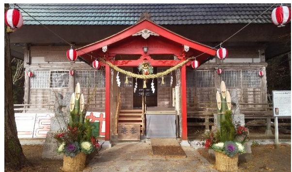
▲二宮神社の門松(奥屋)