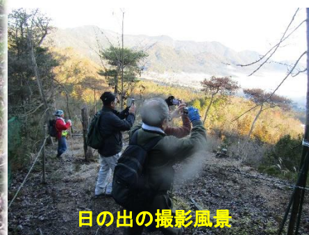
日の出の撮影風景

令和を迎え最初の「初日の出」を、海軍山から見ることができました。 朝6:00から登山を開始し、7:00前に山頂へ到着しました。 気温は零下2度と寒い朝でしたが、快晴に恵まれ山の頂上に輝く太陽が現れると幻想的な気持ちとなり、一斉に「素晴らしい。きれい。」と声を発していました。 FM放送の記者も、生中継で、この美しい模様を実況放送されていました。