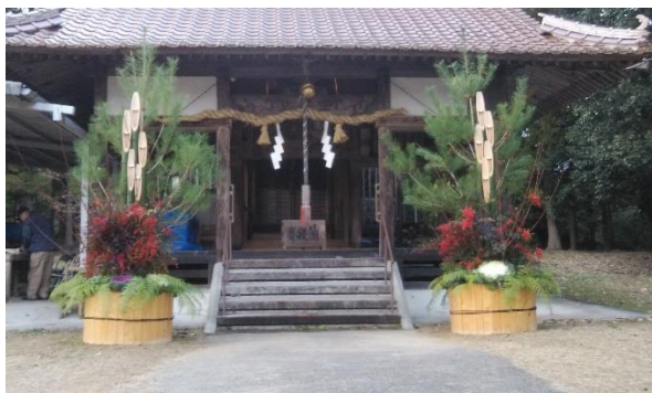
▲志和神社の門松(志和西)