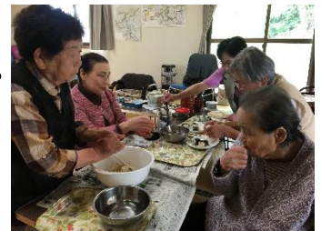
サロンで料理を作り昼食会