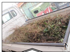
トラック一杯になった草やゴミです。