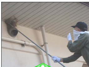
つばめの巣を取り除いています