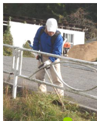
センター周辺の草刈り作業中

また、綺麗になったセンターを、ご利用いただけるよう色々な講座を計画いたしますので、ご指導ご協力宜しくお願いいたします。