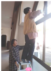
脚立の上での窓拭き作業、高い高い!