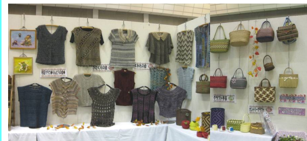
力作ばかりです。素敵!と見学者の声でした。