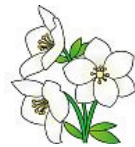
クリスマスローズ