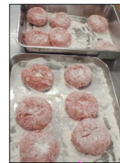
米粉入りハンバーグ