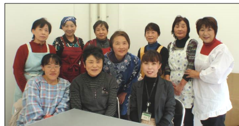
船越さん囲んで参加して下さった皆さま