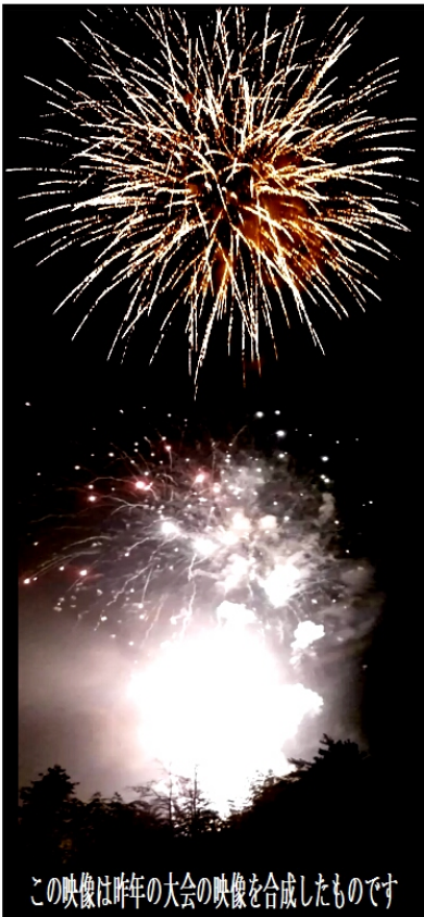
この映像は昨年の大会の映像を合成したものです

皆様の声をお寄せ下さい 八本松小学校住民自治協議会事務局 八本松地域センター内 Tel・Fax 082(428)3061 当協議会スタッフは常勤でないため返事が遅くなる場合があります。