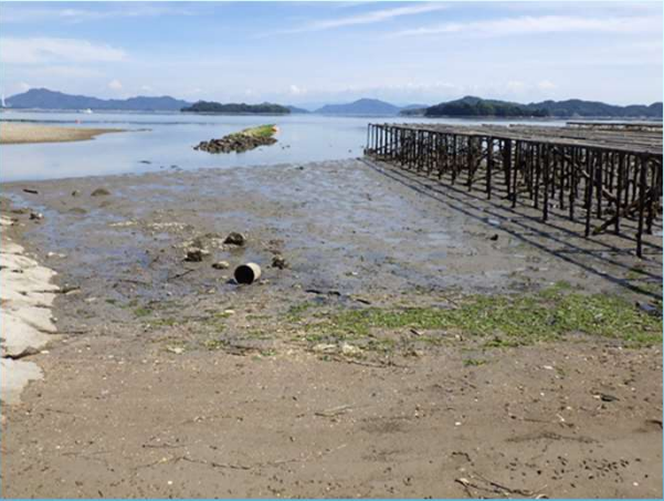
カキ抑制柵と周辺底質の状況 (2021.9)