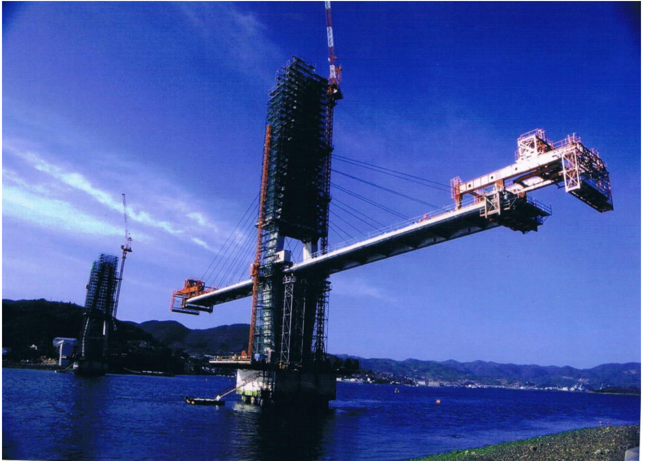
建設中の大芝大橋