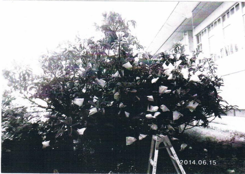
収穫を待つ？ ビワの木です