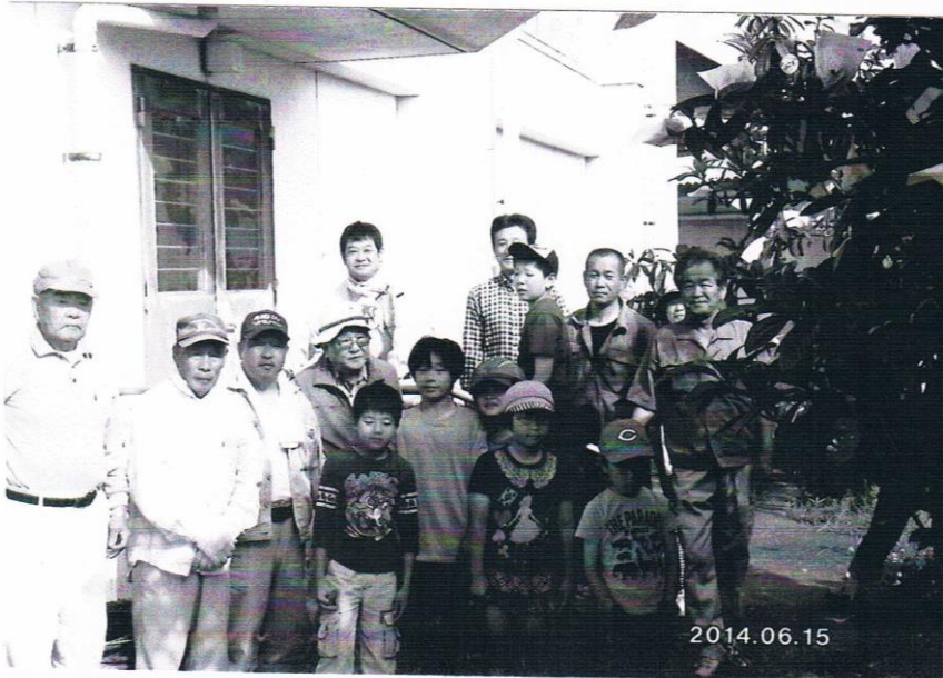
収穫に参加された 皆さんです