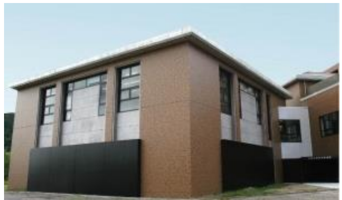
本館外装は広大工学研究科教授デザインによるもので 福山市の JFE スチールより寄贈の黒色の銅板を使っています

広島大学は、大学キャンパス全体に広く博物館機能を持たせた「大学まるごとミュージアム」となっています。今回は常設展示を行っている本館をじっくりと見学します。