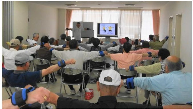
東広島市が推進する介護予防のための筋力トレーニング「いきいき百歳体操」。今年2月6日に開始し毎週月曜日午後1時から地域センターで実施中です。毎回30人前後が取り組んでいます（参加費は無料）。