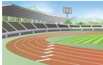
6月4日、第29回東広島市民スポーツ大会（陸上の部9種目）が、東広島運動公園陸上競技場で開催され、参加した35の小学校区チームのうち木谷チームは12位と健闘しました。