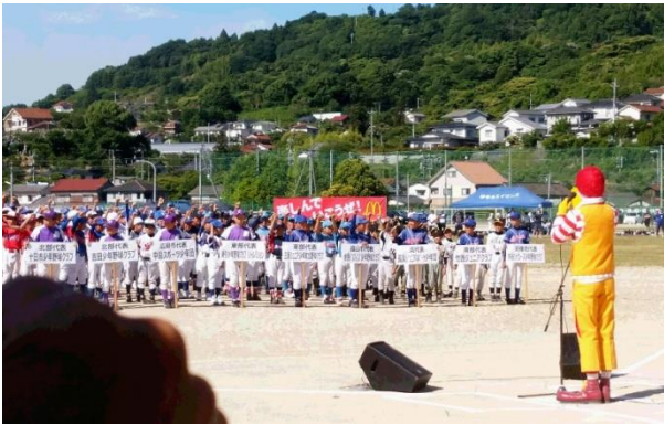
「木谷ジャガーズ少年野球クラブ」が、6月17日に行われた「高円宮賜杯第37回全日本学童軟式野球大会マクドナルド・トーナメント」の広島県代表を選ぶ試合に出場しました。