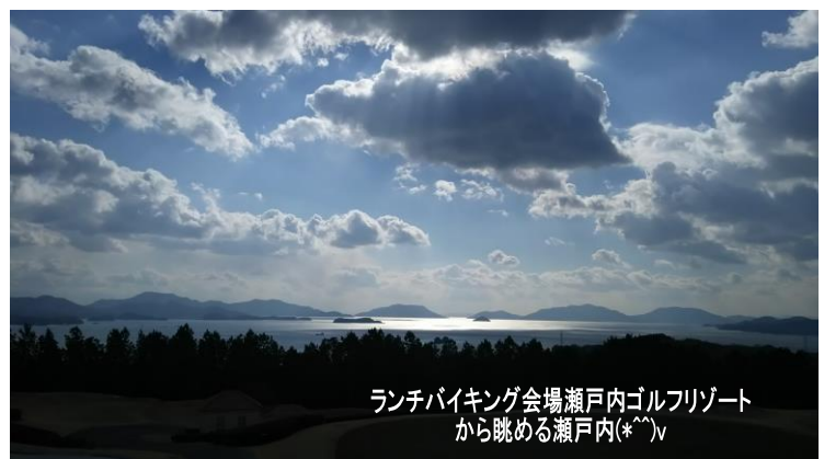
ランチバイキング会場瀬戸内ゴルフリゾートから眺める瀬戸内(*^^)