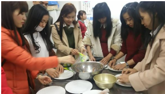
ベトナム 春巻きを 作りました。