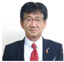
中曾 住民自治協議会会長

えのことと、お慶び申し上げます。早いもので、平成25年の会長就任以来、4回目の新年を迎えることが出来ました。これまで、子どもからご年配の方までだれもが「大好き!