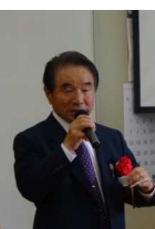
波光長寿会 会長の乾杯

全員で弁当を食べながら会話も弾み、写真に納まり笑顔の時間が続きました。この間、今年節目の年齢を迎える方を紹介。77歳が11名、90歳が5名、百歳以上が3名です。