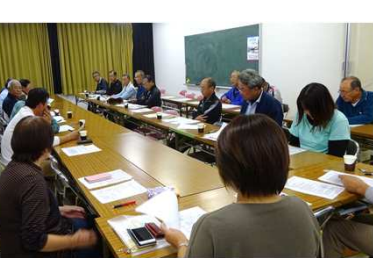
第1回文化祭会議の様

展示販売、健康教室を準備は、11月9日(木)13時30分から10日(金)8時から展示品搬入・飾付等の作業を行います。準備作業は、11月9日(木)13時30分から10日(金)8時から展示品搬入・飾付等の作業を行います。準備作業は、11月9日(木)13時30分から10日(金)8時から展示品搬入・飾付等の作業を行います。