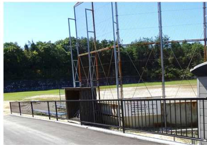
【吉川工業団地公園として整備】