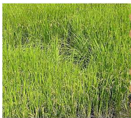
イノシシによる水田被害の模様

草刈り後に放置された草の下にいるコオロギなどはイノシシの好物と言われ、落ちた柿・栗の他、捨てられた野菜くずなどにも配慮した作業が必要です。