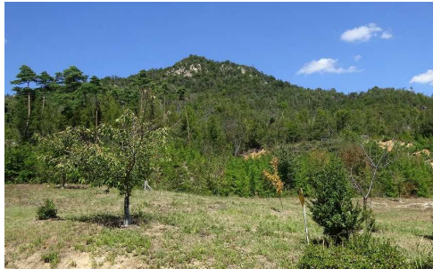
【槌山城を背景とした長寿の森】

長寿の森の広場と小屋は、吉川小学校児童の遠足や地域の集まりなどに利用されています。