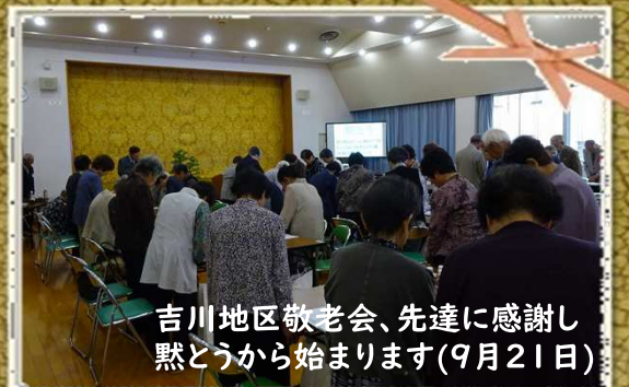
吉川地区敬老会、先達に感謝し黙とうから始まります(9月21日)