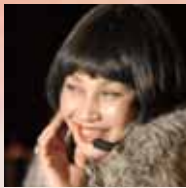
三橋千鶴 (メゾソプラノ)