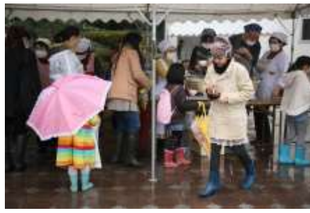
ぜんざいを食べて・・・冷えた体も温まりました！

スタンプラリーの交通整理や小学校でのもちつき、ぜんざい・甘酒のふるまいにご協力いただいた地域の皆様、参加された皆様、雨の中をありがとうございました。