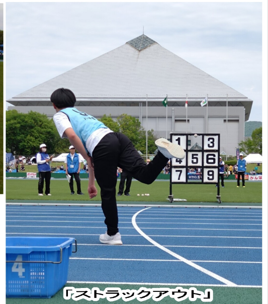
「ストラックアウト」