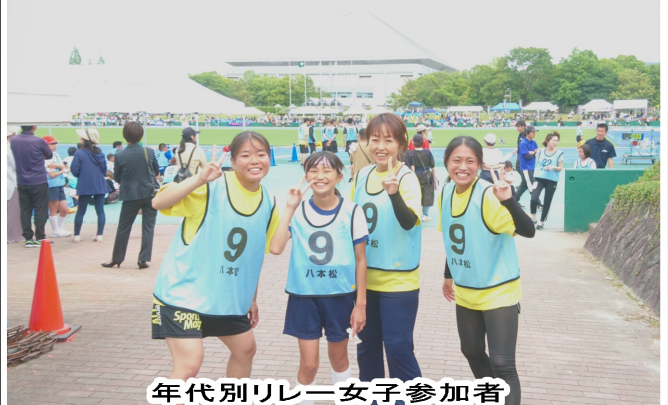
年代別リレー女子参加者