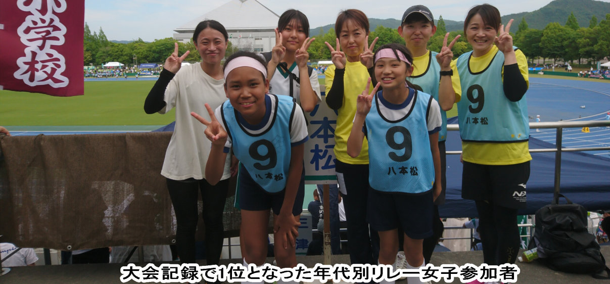
大会記録で1位となった年代別リレー女子参加者

陸上の部では6位に終わったが、秋に開催される球技の部（9月24日）で、強力な八本松の力を見せて総合優勝を目指す。