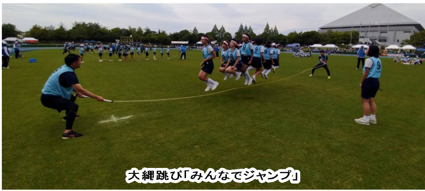
大縄跳び「みんなでジャンプ」