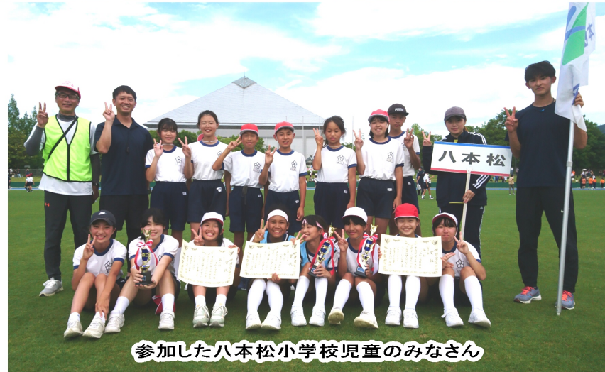
参加した八本松小学校児童のみなさん