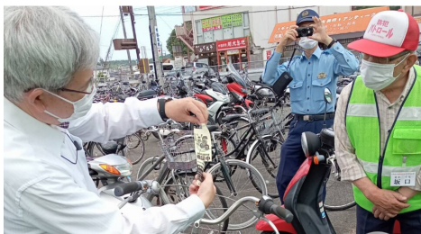
無施錠を知られないよう、「自転車盗難対策 検証中」と書かれたラベルを取り付ける

無施錠自転車 施錠指導実施 東広島警察署/東広島防犯連合会/自治協 防犯交通部会