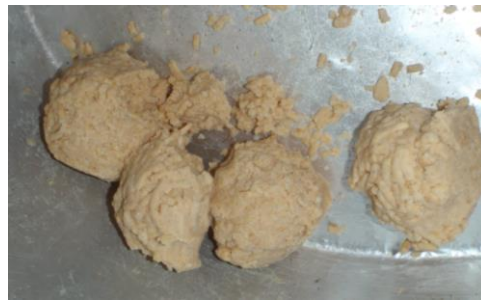
『美味しい味噌になーれ』と 樽に詰めています。