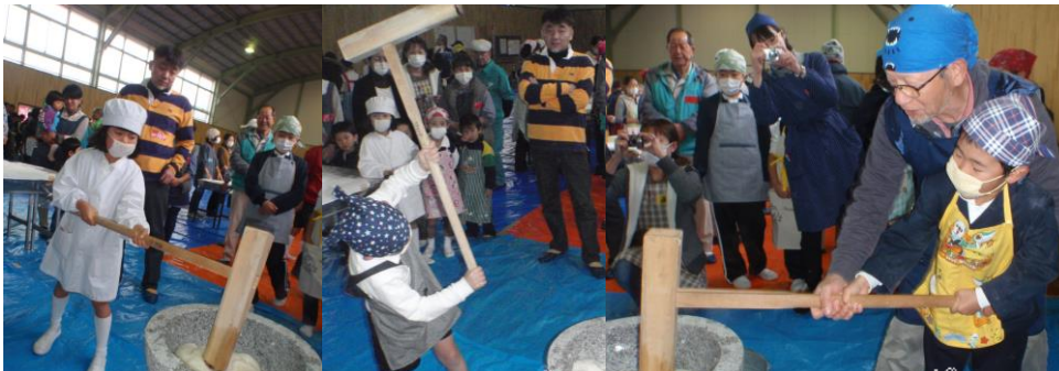
ペタン、ペタン楽しく搗きました。全員での記念写真