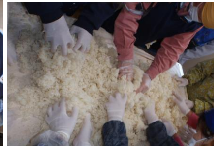
米に麹菌を植え付けています。 うまく麹菌がつかますように！