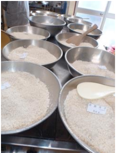
麹・塩を5キロづつ 分配しています。