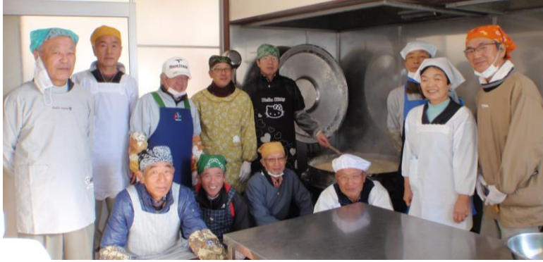
男の料理教室の皆さんです。割烹着も様になっています

11月の25・26・27日の3日間で、味噌作りに挑戦しました。今年で2回目の味噌作りとなりました。一年後に『美味しい味噌になっているといいな』と言いながら気持ちを込めて挑戦しました。手早く、テキパキと動かれる事に感心しました。2月4日・5日・6日にもう一度200キロの味噌作りに挑戦します。