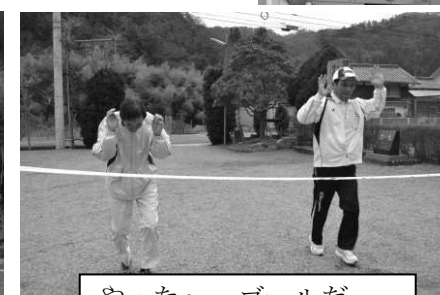
やった～。ゴールだ。がんばったよ！！