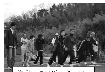
位置について、よーい、スタート！がんばれ