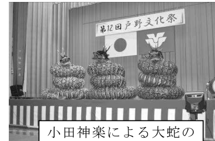
小田神楽による大蛇の舞です。迫力満点！