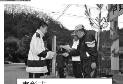
表彰式 おめでとう！！