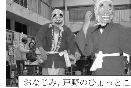
おなじみ、戸野のひよっこです。楽しい踊りです