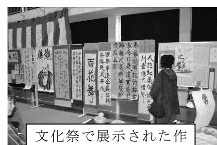
文化祭で展示された作品です。すばらしい！