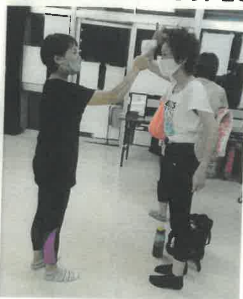
自宅で検温に加え、さらに会場でも検温します