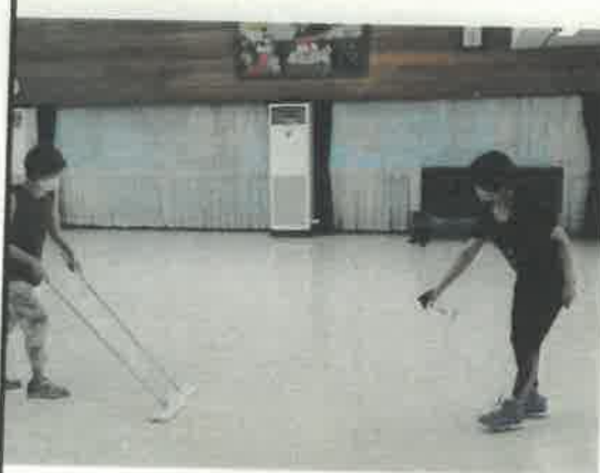
活動が始まる前と後に消毒液をつながらフロアを拭きます。