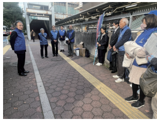
石崎税務署長ご挨拶

JR 大崎駅西口に、品川税務署・品川都税事務所・品川区税務課・品川納連メンバーが集合し、大崎駅周辺・さらに不動前商店街までの事業者を対象に「消費税完納、キャッシュレス納付」勧奨して貯金缶を配布して回りました。