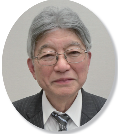
品川納税貯蓄組合連合会长