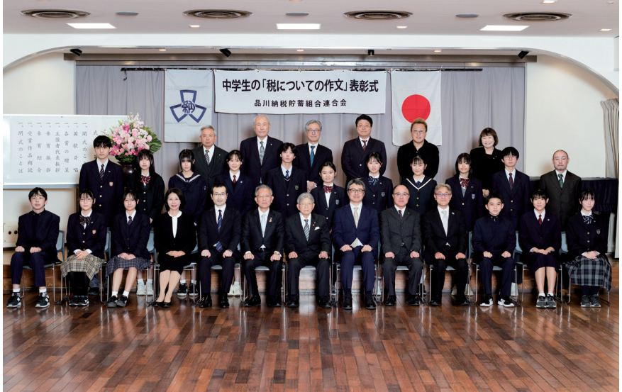
作文表彰式 受賞の方々と