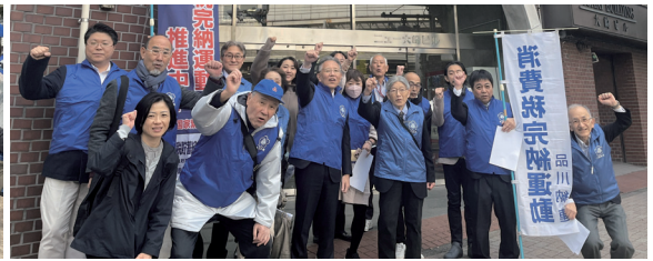
キャンペーン活動前の集合写真「ガンバルゾー！」