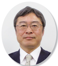
品川都税事務所長