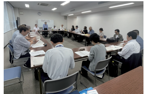
作文審査会の様子

審査委員はそれぞれ候補作品について感想・所感を述べ、千葉顧問による講評で審査会は締めくくられました。