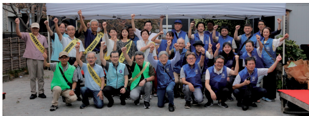
出発前の「ガンバルゾー！」は今年も酒販連の皆様と一緒に！

好天に恵まれ沿道は午前中から賑やかです。今年は、酒販連合会のメンバーと合同でグッズを配りました。