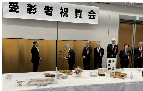
主催者として署長に向い宣言する東條会長

品川税務署主催の納税表彰式の後、品川税務連絡協議会を構成する税務 6 団体 (品川納税貯蓄組合連合会・東京税理士会品川支部・品川青色申告会・品川法人会・品川間税会・品川酒販連合会) は、品川税務署とともに、共同してキャッシュレス納付の一層の普及推進をはかることを宣言いたしました。