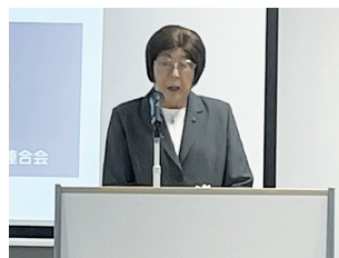
秋山玉川納連会長挨拶

城南地区協議会とは、品川・大森・世田谷・雪谷・蒲田・玉川・荏原・北沢・渋谷・目黒の各納貯連合会で構成され年一回の協議会を開催しています。今年度は玉川納貯貯蓄組合連合会が担当、会場は東急大井町線等々力駅前 玉川区民会館でした。各納連の組織の現状と今後の取組み等が披露されました。